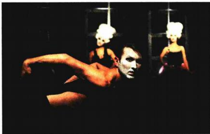
Iz predstave »A world in-between« Skopje Dance Theatra